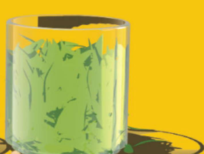
ERBA MEDICA VITAMINE E MINERALI